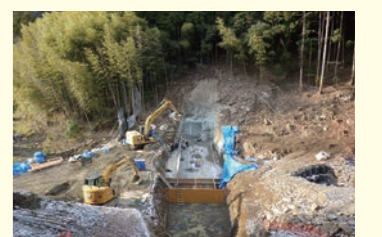
古瀬畑川砂防事業