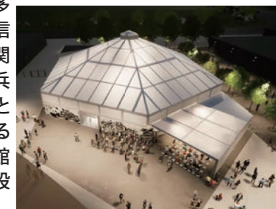
関西パビリオンのイメージ提供：関西広域連合