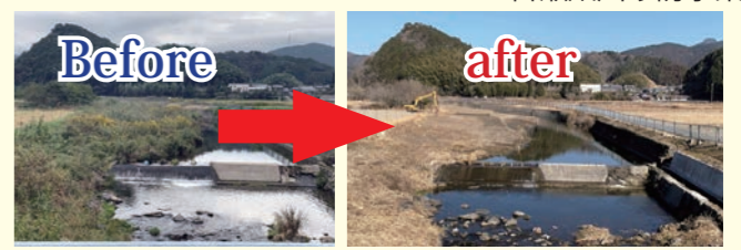
菅生川(助野地区)河川支障木伐採