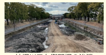
外堀川三左衛門堀の浚渫

処分費が莫大な土砂処分費。良い材質の夢前川の河川内土砂(宮置橋～清水橋)は、姫路土木事務所と知恵を出し合い、外堀川左衛門堀の河床掘削工事に必要となる「工事用進入路の材料」として活用