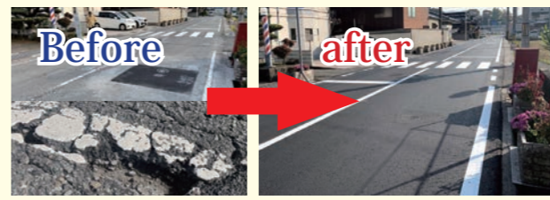
県道姫路神河線(67号線)舗装工事