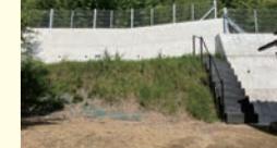
木場地区急傾斜事業