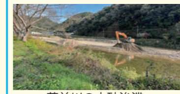
夢前川の土砂浚渫

処分費が莫大な土砂処分費。良い材質の夢前川の河川内土砂(宮置橋～清水橋)は、姫路土木事務所と知恵を出し合い、外堀川左衛門堀の河床掘削工事に必要となる「工事用進入路の材料」として活用