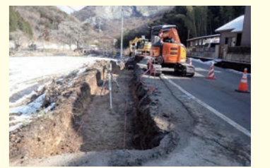
山之内筋野姫路線